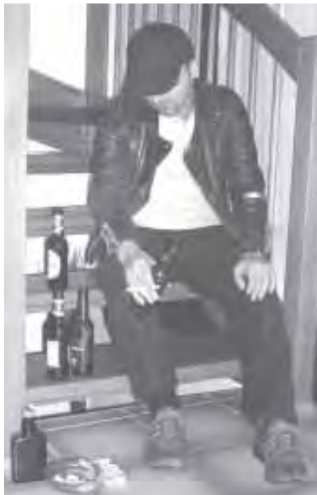
Das ist weder komisch, noch ist er ein Held!

Wichtig ist aber trotzdem, dass sie wissen, dass es für Betroffene Hilfe gibt und unsere Hand ausgestreckt ist. An die Anonymen Alkoholiker können sie sich erinnern, wenn es in der Familie oder im Freundeskreis ein Alkoholproblem gibt – oder auch dann, wenn sie wider Erwarten doch in naher oder ferner Zukunft selbst in die Abhängigkeit geraten.